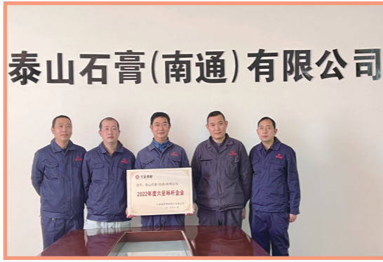
泰山石膏（南通）有限公司