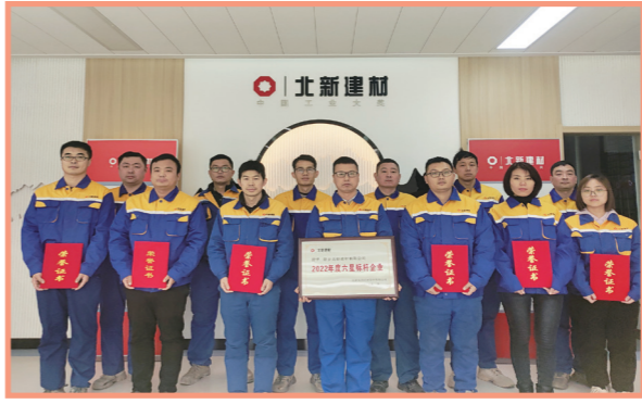
★ 新乡北新建材有限公司