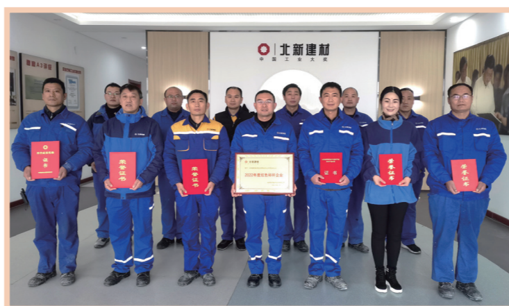
北新建材枣庄分公司