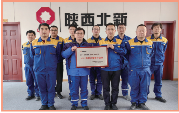
★ 北新建材（陕西）有限公司