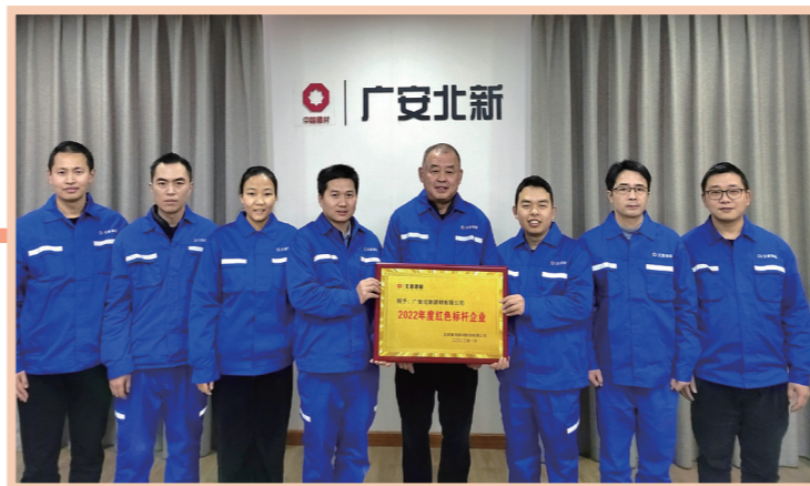
广安北新建材有限公司