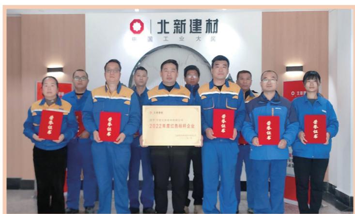
宁波北新建材有限公司