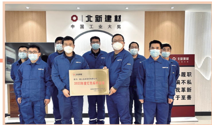
镇江北新建材有限公司