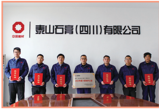
★ 泰山石膏（四川）有限公司