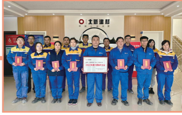
★ 北新建材（嘉兴）有限公司