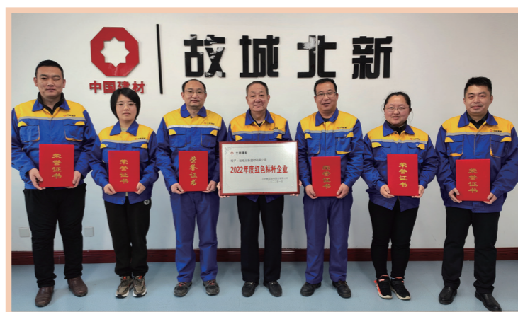
故城北新建材有限公司