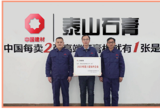
泰山石膏 中国每卖2张高端石膏就有1张是