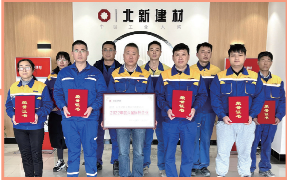
★ 北新建材（苏州）有限公司