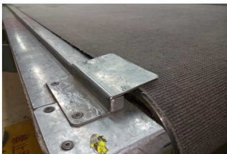
图一 防夹手护板参考图