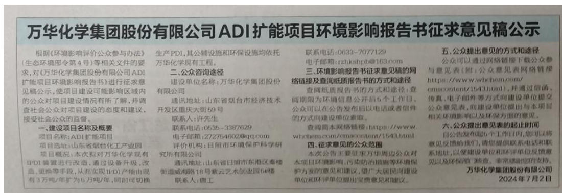
图 2.2-3b 本项目环境影响报告书征求意见稿第二次报纸公示（7 月 8 日）