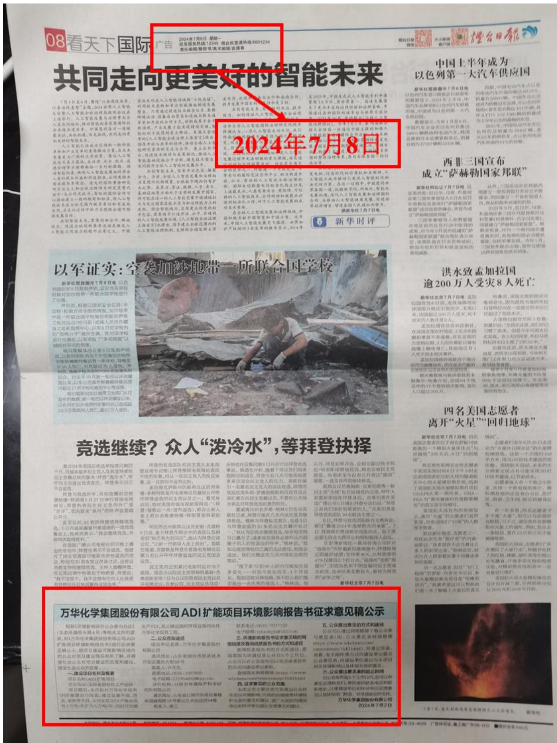
图 2.2-3a 本项目环境影响报告书征求意见稿第二次报纸公示（7月8日）