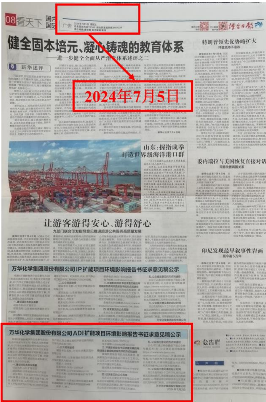
图 2.2-2a 本项目环境影响报告书征求意见稿第一次报纸公示（7 月 5 日）