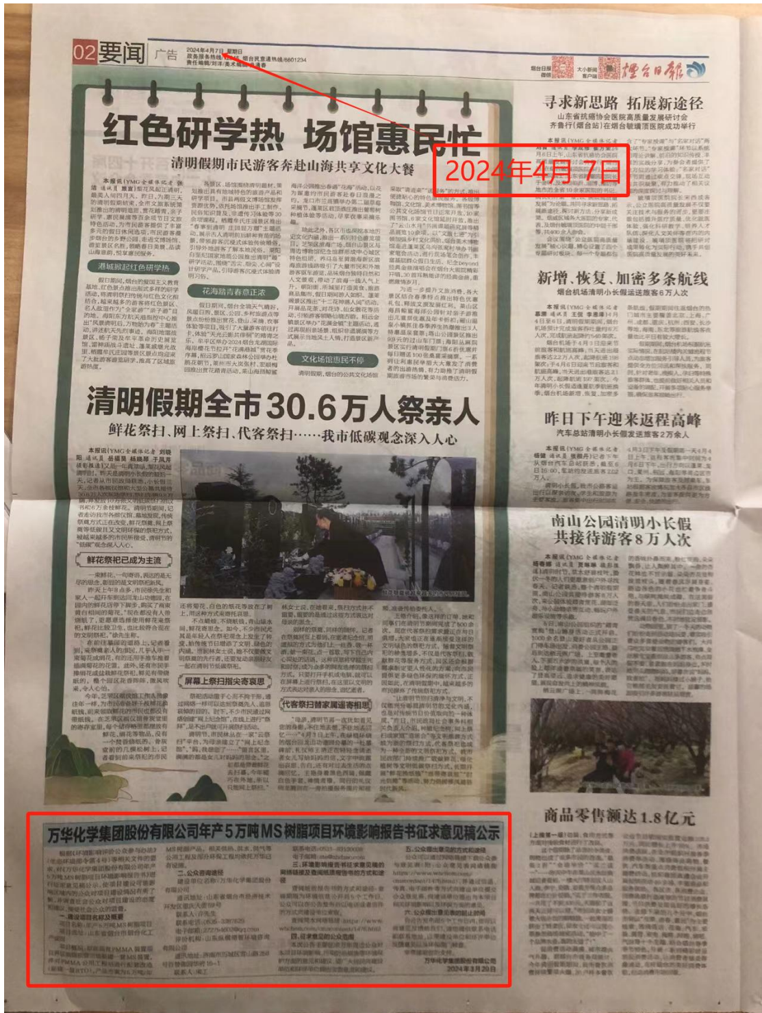
图 2.2-3(a) 本项目环境影响报告书征求意见稿第二次报纸公示 (4月7日)