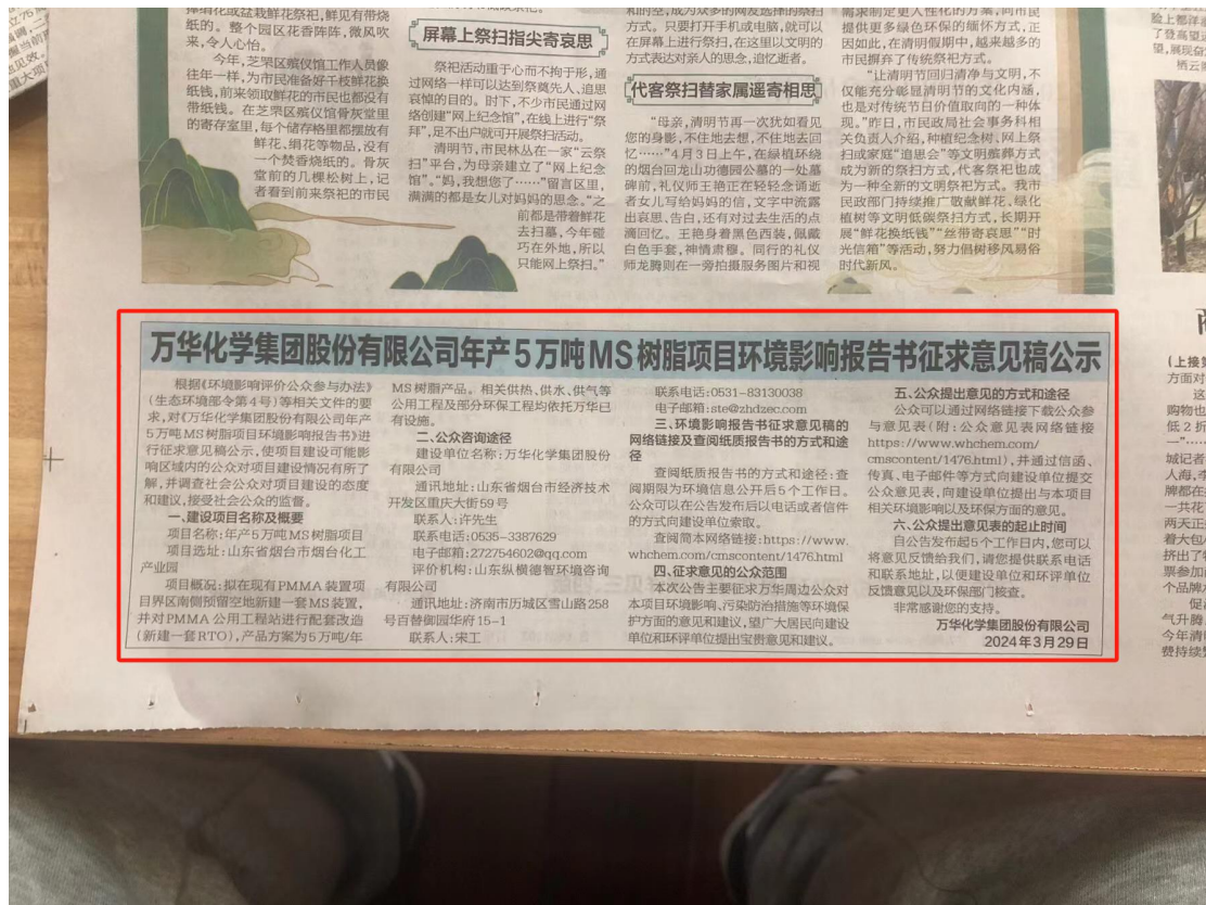
图 2.2-3(b) 本项目环境影响评价报告书征求意见稿第二次报纸公示（4月7日）