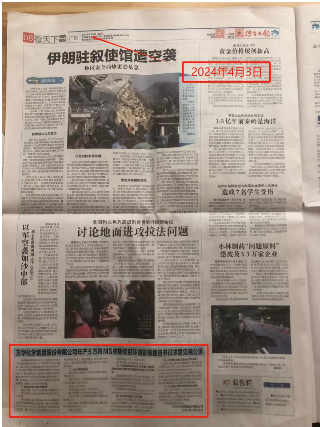
图 2.2-2(a) 本项目环境影响报告书征求意见稿第一次报纸公示（4月3日）