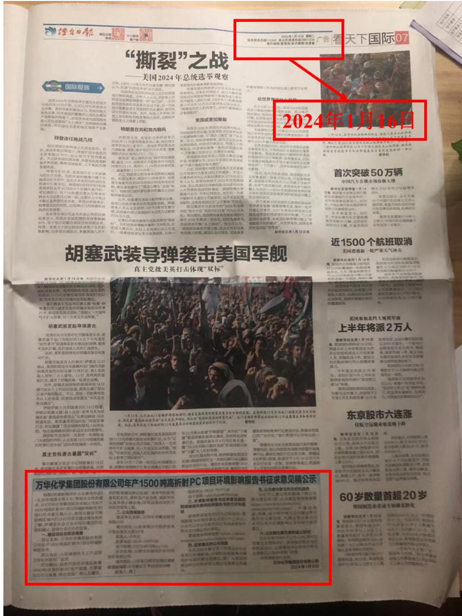
图 2.2-3a 本项目环境影响报告书征求意见稿第二次报纸公示 (01 月 16 日)