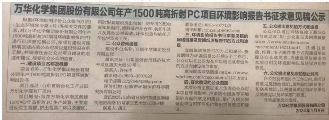
图 2.2-2b 本项目环境影响报告书征求意见稿第一次报纸公示（01 月 15 日）