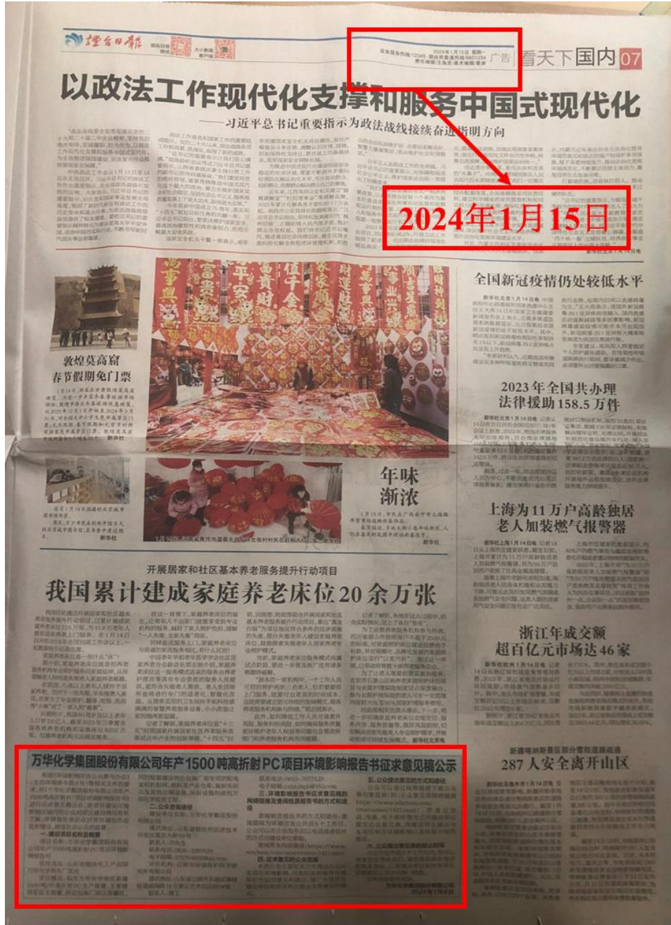
图 2.2-2a 本项目环境影响报告书征求意见稿第一次报纸公示（01 月 15 日）