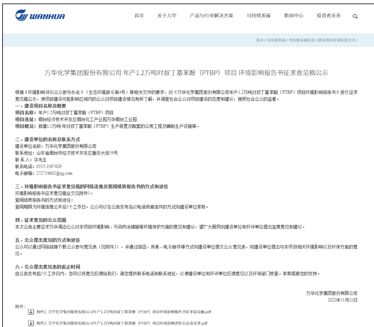
图 3.2-1 本项目征求意见稿公示网络截图