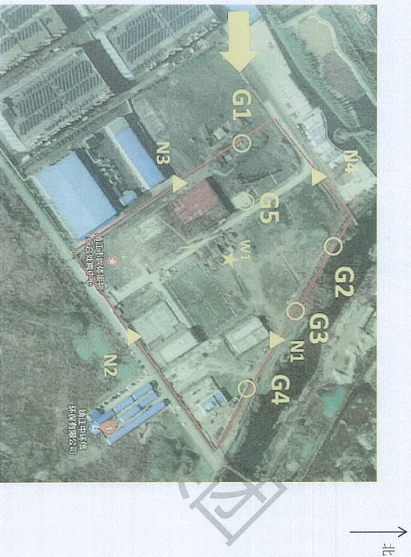
废水、废气、噪声监测点位示意简图

备注： ○ 为无组织废气监测点点位； ⊙ 为有组织废气监测点点位； ★ 为废水监测点点位； ▲ 为噪声监测点点位；